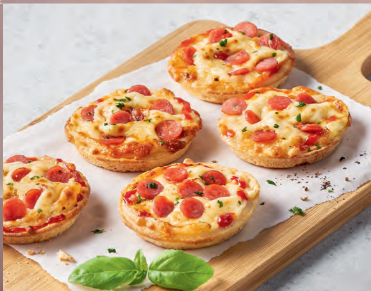
0336 Pizzettis au salami